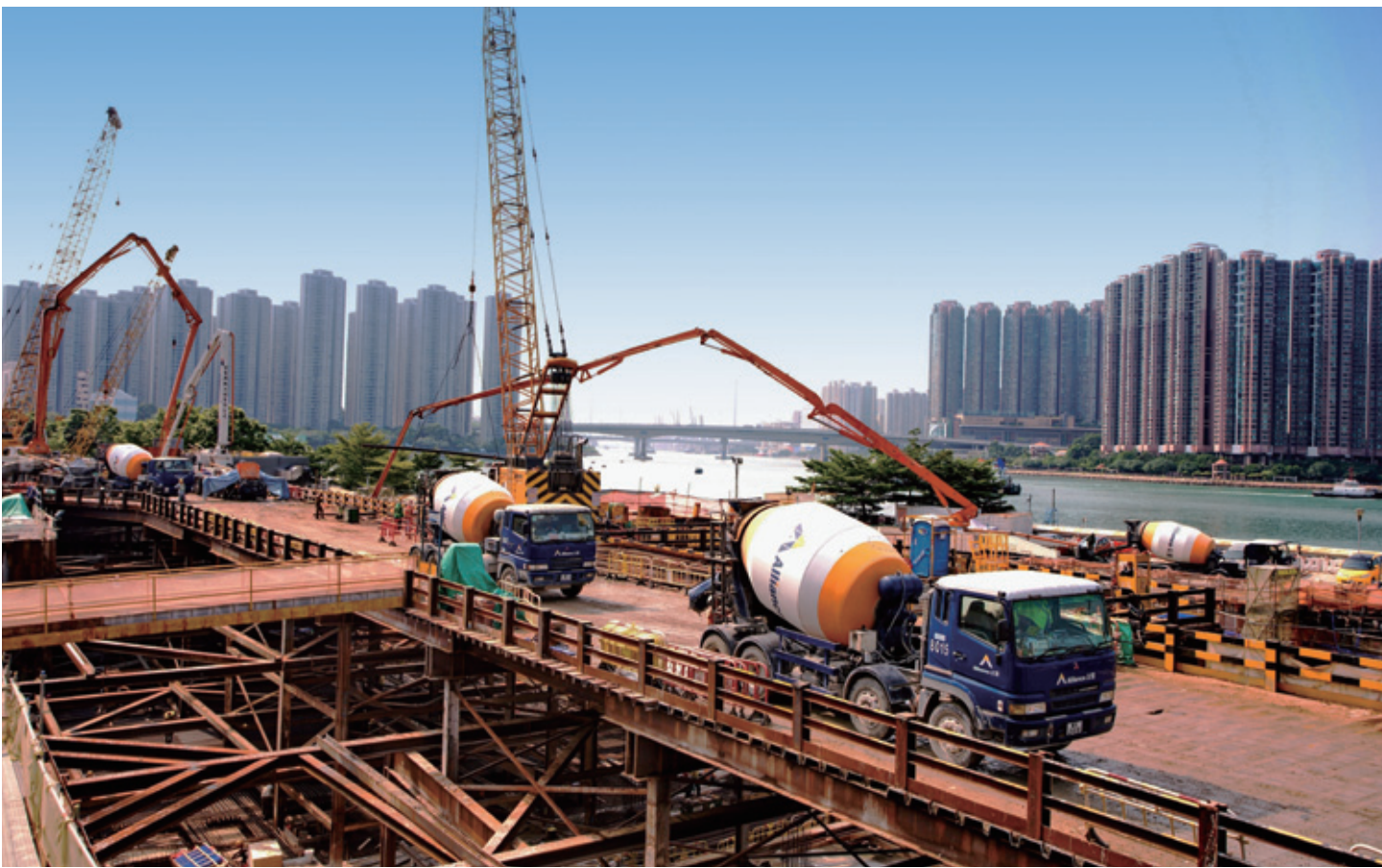
集團的材料業務與二零一六年的財務預算相符。

長江基建的混凝土及石料業務由友盟建築材料有限公司負責營運，該公司乃長江基建與 HeidelbergCement AG 的合營公司，長江基建持有百分之五十權益。雖然年內下半年之經營環境競爭越趨激烈，該公司仍錄得理想表現。