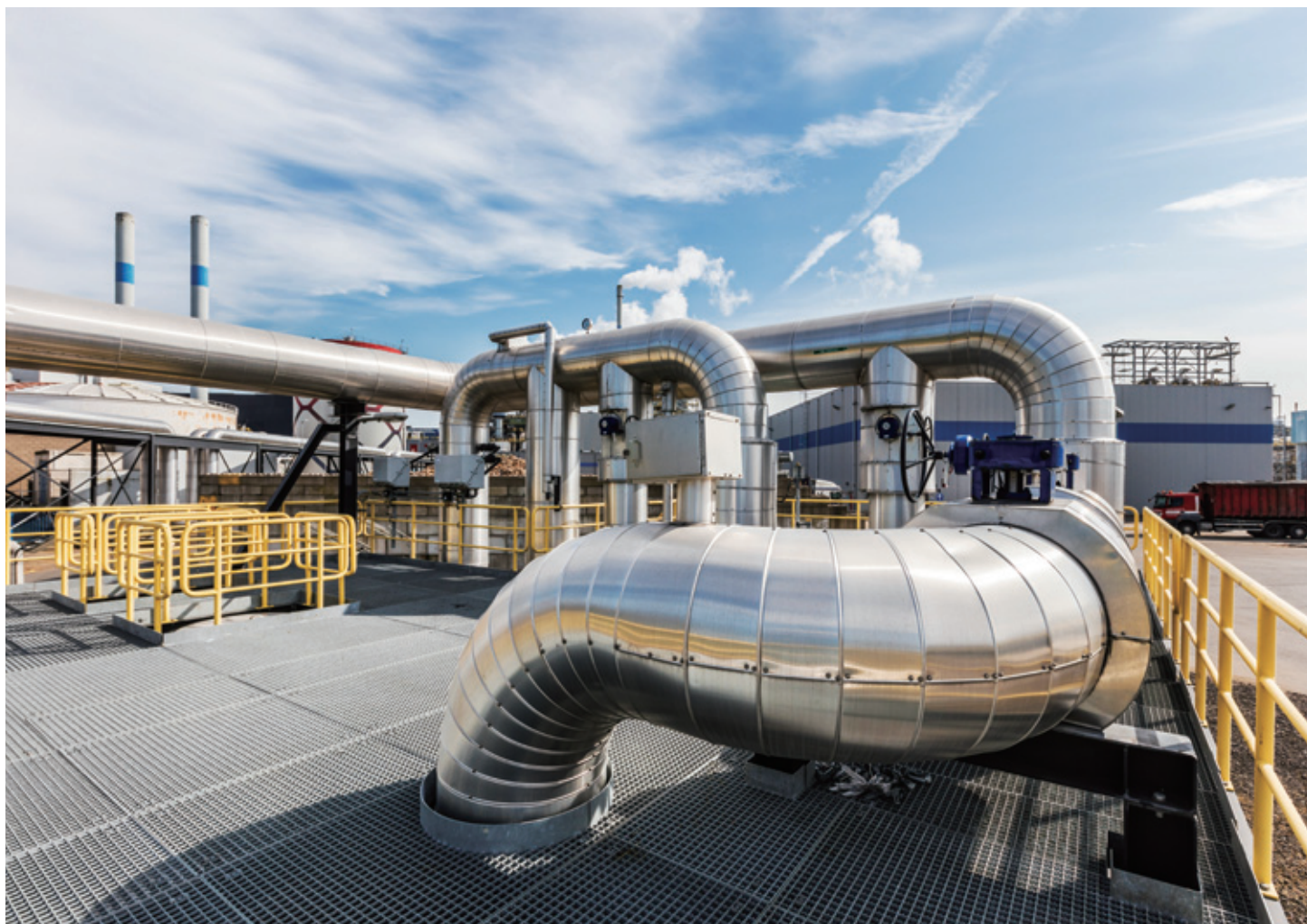
Dutch Enviro Energy 擁有荷蘭最大之「轉廢為能」公司 AVR，該公司於二零一六年的溢利貢獻增長穩健。

於二零一六年，Dutch Enviro Energy 的溢利貢獻增長穩健，較預期為佳。該公司於年內完成一項由 Rozenburg 及鹿特丹現有區域暖氣網連接至海牙的可行性研究。此外，該公司並就收集碳(二氧化碳)供溫室使用進行先導研究，有關研究亦已完成。