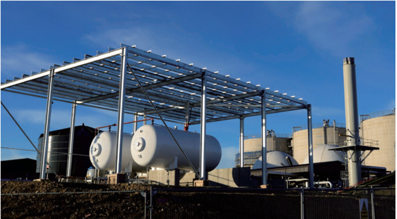
Northern Gas Networks 在英國能源監管機構 Ofgem 之客戶滿意度調查中繼續名列前茅，排名首兩位。

Northumbrian Water 繼續致力提供卓越顧客服務，並同時維持成本效益。於英國能源監管機構 Ofwat 的二零一六/二零一七年度客戶滿意度調查中，該公司在英格蘭及威爾斯的整個水務界別排名第一。Northumbrian Water 於英國水務公司調查 (British Water Survey) 中亦被評為「Top Water Company」，此乃過去七年內第六度獲此嘉許。該公司亦於 Waterwise UK Water Efficiency Awards 中獲取三個獎項，並榮獲 The Royal Society for the Prevention of Accidents (RoSPA) 頒發「Gold Medal」獎項，以表揚該公司連續五年保持一貫的優質服務水平。此外，Northumbrian Water 亦獲頒「Sustainable Drainage and Flood Management Initiative of the Year – Water Industry Achievement Award」。