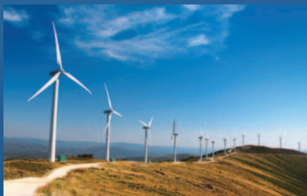
歐洲大陸 基建投資