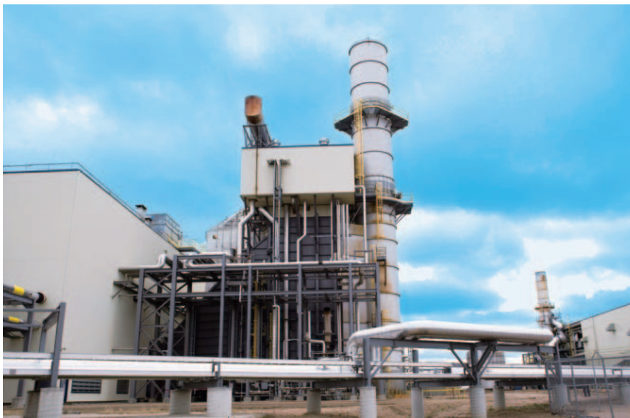
Canadian Power 旗下電廠的總裝機容量為一千三百六十八兆瓦，能為超過五十萬戶家庭供應電力。

Park'N Fly 於二零一六年表現強勁，業務增長帶動生意額提升。年內，該公司實踐其擴展策略，業務延伸至溫尼伯。