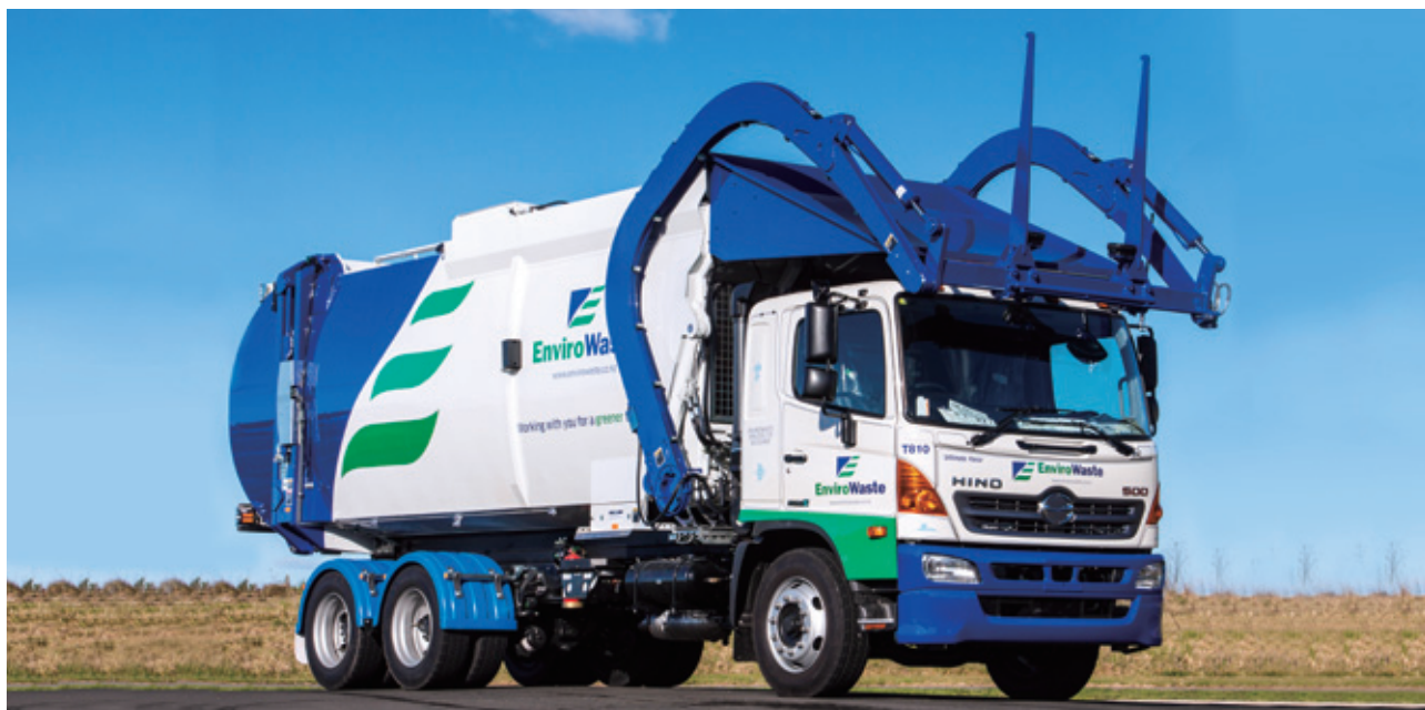
EnviroNZ 於二零一六年的表現理想，各業務收入均錄得內部增長。

EnviroNZ 於二零一六年的表現理想，各業務收入及溢利均錄得內部增長，其中 Hampton Downs 堆填區的貢獻最大，該堆填區的廢物處理量於年內再創新高。EnviroNZ 於年內亦獲得 Ashburton 地區垃圾收集及回收合約，為期九年。其奧克蘭 Waitakere 之九年期回收合約亦已開始運作，EnviroNZ 並已於二零一六年在 Hampton PARRC 堆填區內開展建造價值六百萬新西蘭元的反滲透(垃圾滲濾液)處理廠。