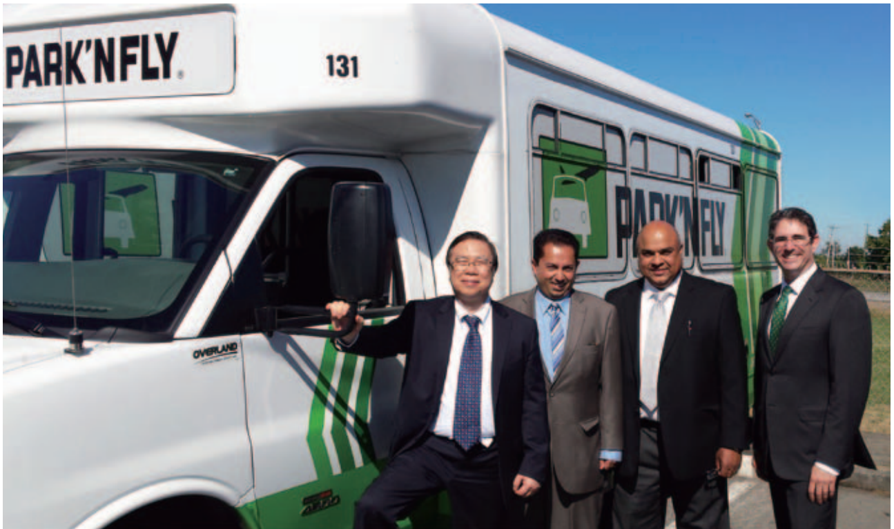
Park 'N Fly 於加拿大機場外圍停車場設施行業的市場佔有率約百分之八十。