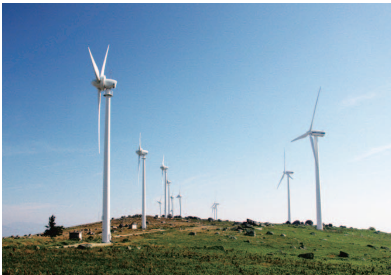
二零一六年的風力發電條件良好，Iberwind 錄得理想的營運表現，供電率高達百分之九十七點四。

公司。Iberwind 是葡萄牙第二大風力發電公司，市場佔有率約百分之十五。現時，Iberwind 於全葡萄牙不同地區設有三十一個風電場，總裝機容量為七百二十六兆瓦。於二零一六年，Iberwind 提升既有五個風電場的產能，讓裝機容量再多增四十二兆瓦。Iberwind 把三百三十九台風力發電機組所生產的電力全部售予電網。二零一六年的風力發電條件良好，Iberwind 錄得理想的營運表現，供電率高達百分之九十七點四。該項目為集團提供之回報令人滿意。