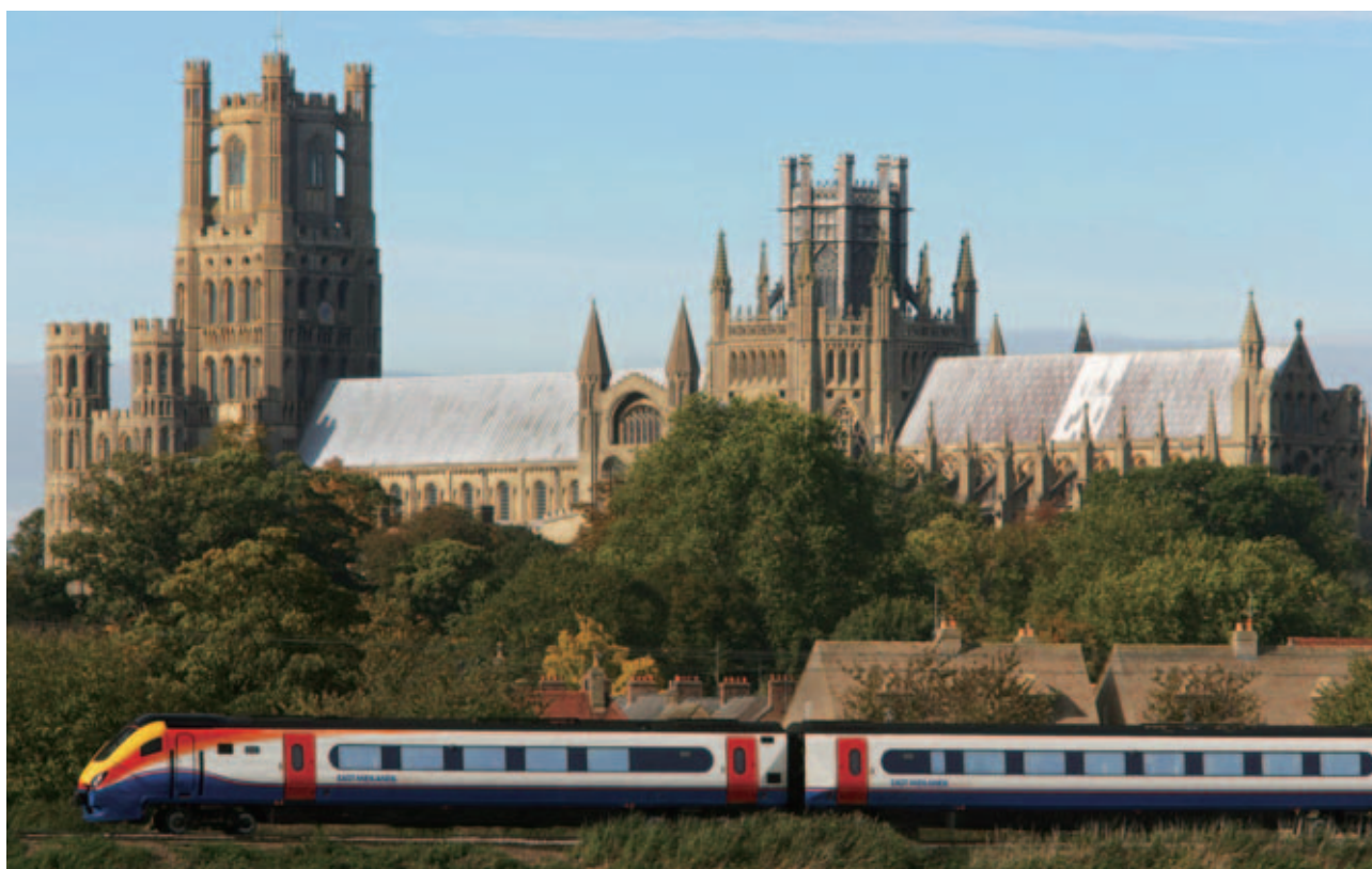
UK Rails 於二零一六年獲三家客戶承造價值共七億四千四百萬英鎊的新列車。

年內，UK Rails 的表現符合預期，為集團帶來穩定回報。該公司於二零一六年獲三家客戶承造價值共七億四千四百萬英鎊的新列車，包括：為 Arriva Rail North 而訂購的一百四十一輛 331 型新車卡及一百四十輛 195 型新車卡，兩批車卡合共涉資四億九千萬英鎊，均由西班牙的 CAF 建造；為 TransPennine Express 而訂購的六十輛 397 型新車卡，涉資一億一千四百萬英鎊，亦由 CAF 建造；以及在二零一五年與 Great Western Railway 簽訂的合約中加入六十三輛日立製造的 802 型新車卡，涉資一億四千萬英鎊。隨著新訂單之落實，UK Rails 的列車組合將增添四個車隊，預計該等車隊將由二零一八年始投入客運服務。