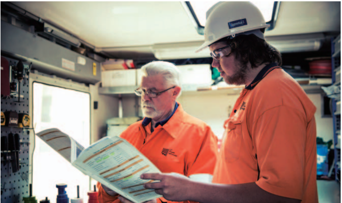
SA Power Networks 之網絡覆蓋範圍約十七萬二千平方公里，為約八十五萬名客戶提供服務。

長江基建與電能實業合共持有 Victoria Power Networks 百分之五十一權益，該公司為 CitiPower 及 Powercor 的控股公司。CitiPower 擁有及營運的配電網絡於墨爾本商業中心區及市郊一帶提供服務，用戶數目逾三十二萬八千名。Powercor 則是維多利亞省最大的配電商，服務範圍覆蓋該省中西部及鄉郊地區，以及墨爾本西面市郊，為逾七十八萬六千名用戶供應電力。