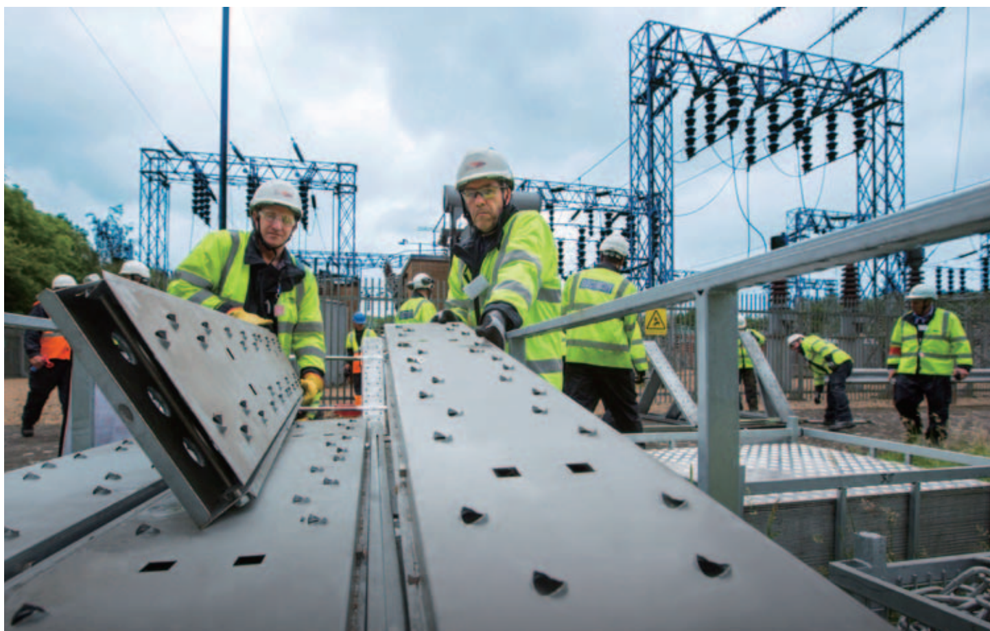
UK Power Networks 在 Utility Week Awards 中獲頒「Utility of the Year」獎項，是該公司連續兩年獲此殊榮，並為過去五年內第三度獲該獎項，創下業界紀錄。

年內，UK Power Networks 斥資超過五億七千萬英鎊繼續進行網絡投資，當中包括於倫敦的巴特錫地區展開造價六千五百萬英鎊的能源基建項目，以應付該區大型房地產發展的需求。