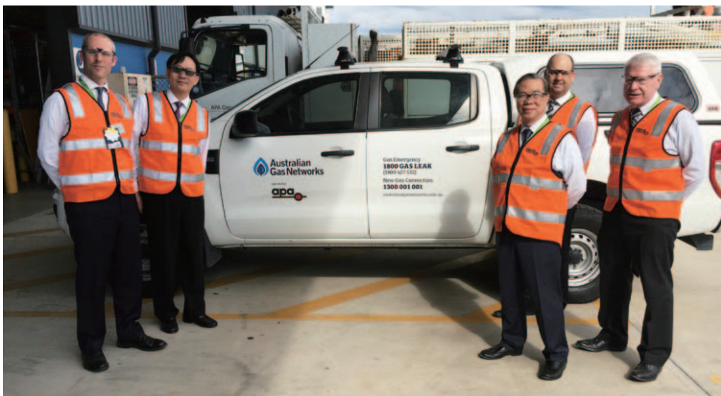
Australian Gas Networks 是澳洲最大的天然氣配氣商之一，為共約一百二十五萬名用戶提供服務。

Australian Energy Operations 於二零一六年的回報理想，錄得令人滿意的年度增長。Australian Energy Operations 與 Ararat Wind Pty Ltd 已簽訂為期二十五年的協議，建造、擁有及經營一個輸電網絡，將二百四十兆瓦的 Ararat 風力發電場所生產之可再生能源輸送到維多利亞省的輸電網。該項目之建造工程經已完成，較原定時間有所提前。此外，該公司與 Mt Mercer 風力發電場簽訂的二十五年供購電力協議仍然生效，有關項目繼續維持高可靠度的表現。該兩個項目共包含兩個變壓站及全長達四十二公里的高壓電纜。