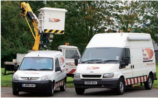
電能實業於 UK Power Networks 的投資顯著擴大國際業務組合。

電能實業的澳洲業務於年內表現良好。南澳洲省唯一配電商 ETSA Utilities 於二零一一年達至所有主要財務指標。受惠於二零一零年至二零一五年的規管業務檢討及上訴結果，網絡收費有所提升，帶動受規管業務收益優於預期。此外，於維多利亞省提供配電服務的 CitiPower 及 Powercor 亦為電能實業提供穩定的溢利貢獻。年內，兩家公司的網絡可靠度大幅提升。