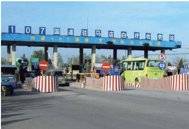
長江基建的收費道路及橋樑皆表現理想。

長江基建持有長沙湘江伍家嶺橋及五一路橋百分之四十四點二權益。該項目是年純利上升百分之五點五。