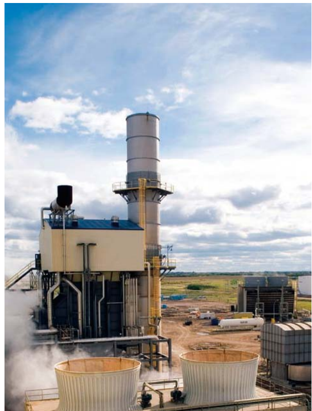
集團收購 Meridian Cogeneration Plant，進一步強化於加拿大的投資組合及收入來源。

Stanley Power 持股百分之四十九點九九的 TransAlta Cogeneration, L.P. 擁有五家電廠之權益，包括四家分佈於阿爾伯達省及安大略省的燃氣熱電廠，以及一家位於阿爾伯達省的燃煤電廠。