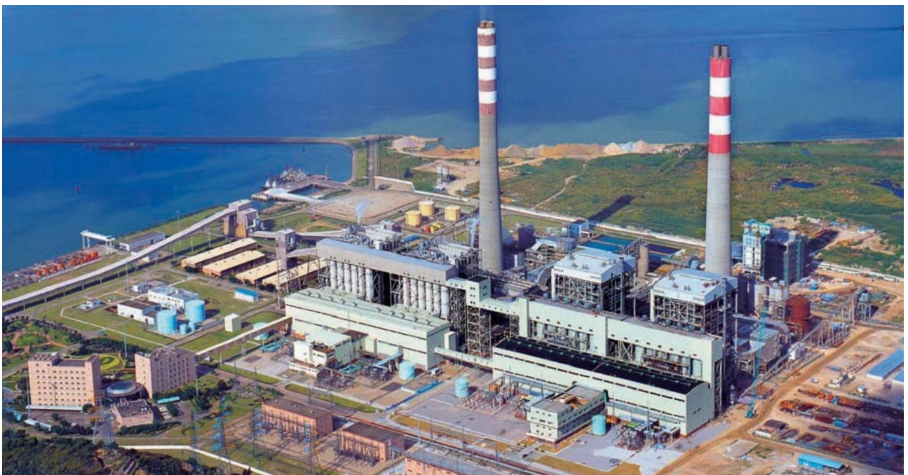
珠海發電廠及金灣發電廠的表現良好。

泰國的 Ratchaburi Power Company Limited 於二零一一年營運表現理想。