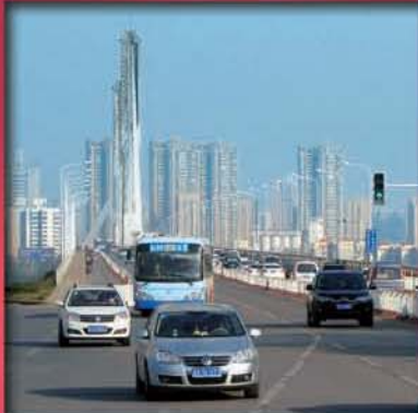
中國內地 基建投資