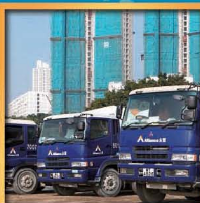
投資於 基建有關業務