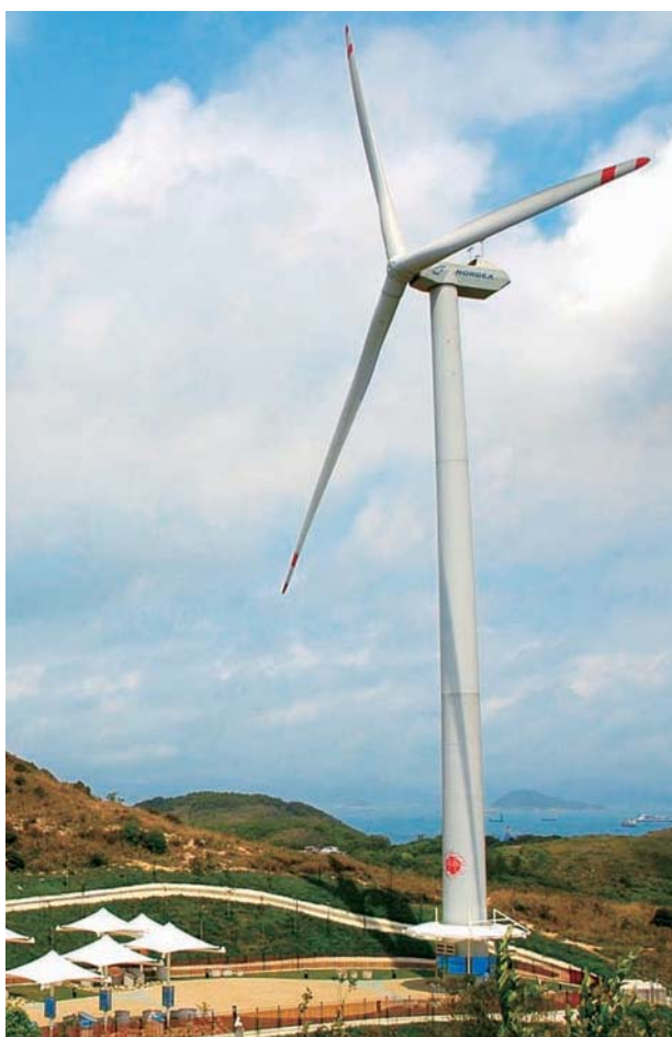
南丫風采發電站於二零一一年產電八十六萬八千度。