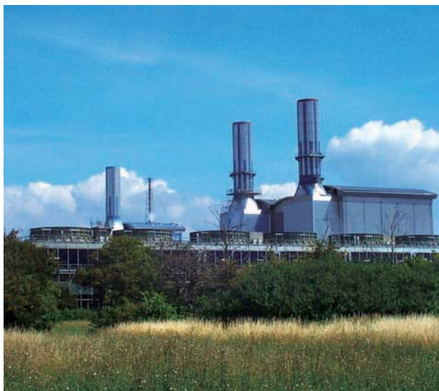
Seabank Power 於二零一一年首度為長江基建提供全年溢利貢獻。

長江基建與電能實業各持有 Seabank Power 百分之二十五權益。該公司於英國布里斯托附近擁有及經營一所聯合循環燃氣發電廠，總裝機容量達一千一百四十兆瓦。