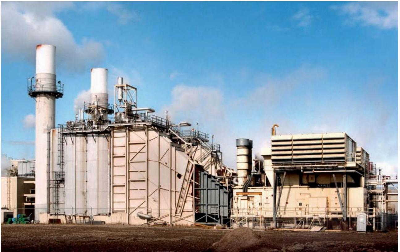
Stanley Power 的業務組合包括加拿大六家電廠，總裝機容量為一千三百六十二兆瓦。