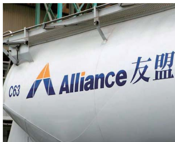
友盟之混凝土及石料售價和銷量均有所增長。

隨著政府十大基建項目展開，友盟之業務亦因建築工程增加而受惠。年內，混凝土及石料的售價和銷量均較去年有所增長，預期二零一二年的銷量將隨基建工程持續進行而進一步上升。