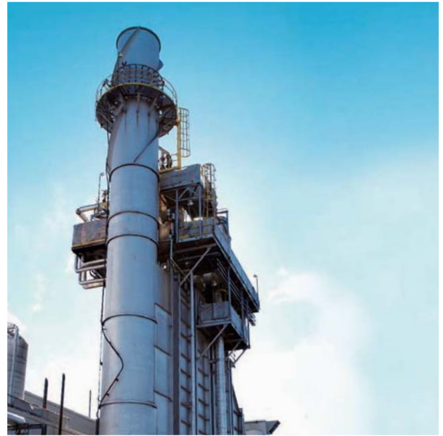
Stanley Power 繼續為長江基建提供穩健可靠之回報。

Stanley Power 於二零一一年的表現理想，繼續為長江基建提供穩健可靠之回報。