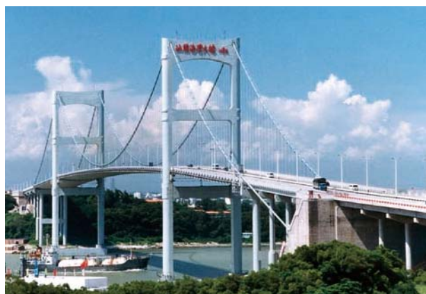
汕頭海灣大橋之路費收入錄得百分之九點八增長。

集團持有唐山唐樂公路百分之五十一權益。受惠於唐山一帶強勁的經濟增長，該項目於二零一一年表現優秀，路費收入增長百分之四十二，股東應佔純利亦隨之上升百分之四十。