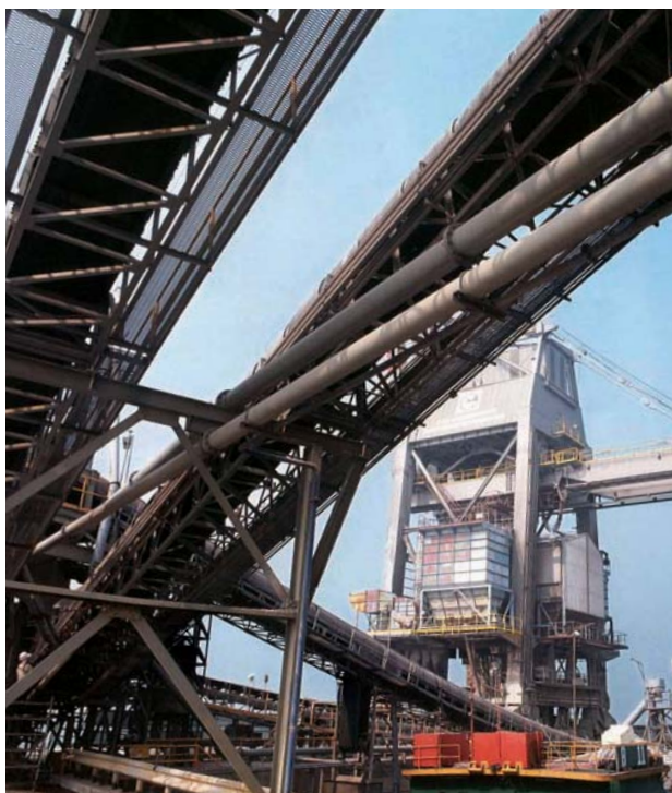
長江基建的基建材料業務整體表現理想。

友盟建築材料有限公司為長江基建與 HeidelbergCement AG 的合營公司，雙方各佔百分之五十權益。長江基建透過友盟從事混凝土及石料業務。該公司於香港市場繼續保持領導地位。