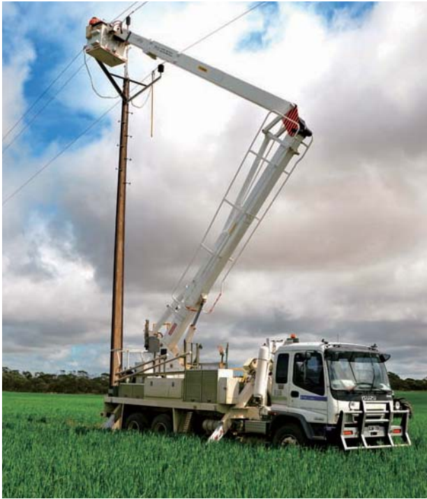
ETSA Utilities 持續達至所有主要財務指標。

ETSA Utilities 在安全度方面一直領導同儕。該公司的安全管理系統於二零一一年初獲澳洲標準 AS 4801 及國際標準 OHSAS 18001 兩項認證。