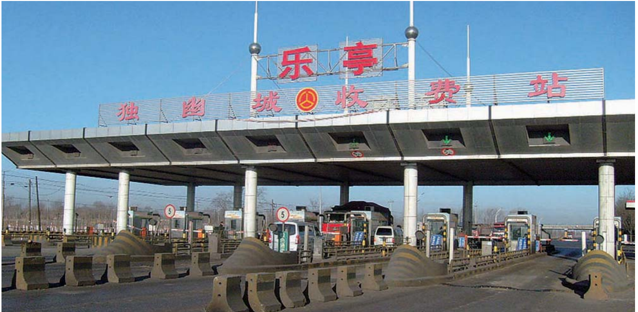
唐山唐樂公路於二零一一年表現優秀，路費收入增長百分之四十二。