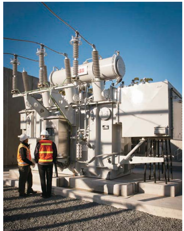
Powercor 是維多利亞省最大的配電商。

在客戶服務方面，CitiPower 和 Powercor 均表現理想。根據二零一一年一項就維多利亞及南澳洲省配電商信譽進行比較的社區信譽指數 (Community Reputation Index) 顯示，CitiPower 的得分於二零一一年上升百分之七；而 Powercor 則連續第十一年獲評為最具信譽配電商，其得分亦按年上升百分之二。