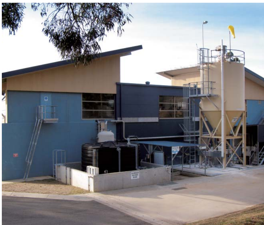
AquaTower 是澳洲維多利亞省內四個城鎮之獨家飲用水供應商。