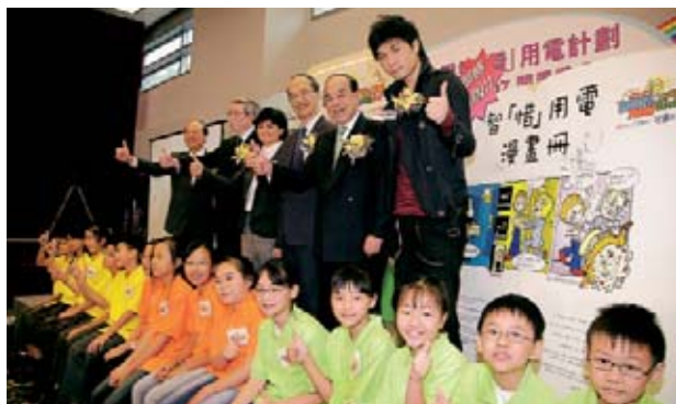
智「惜」用電計劃推廣有效用電及節約能源的訊息。

於二零零六年，該公司在南澳洲省及維多利亞省之配電業務均取得良好的財務及營運表現，超越財務指標。業務收入及需求量於年內均錄得增長。