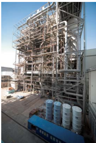
珠海發電廠持續為國家最具效率、最可靠及最安全的發電廠之一。

長江基建持有四平熱電廠百分之四十五權益。該熱電廠設有三台發電機組，總裝機容量為二百兆瓦。於二零零六年，該熱電廠打破二零零五年之紀錄，供應逾十二億度電力及二百四十五萬吉焦熱能。該熱電廠於二零零六年十二月完成建設第三號爐，預期將為吉林電網和四平市提供更可靠的電力和熱能。儘管面對煤價上漲的壓力，四平熱電廠的整體營運成本仍有所下調，為長江基建帶來理想回報。