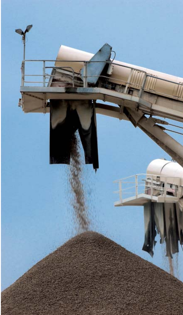
友盟於本地混凝土及石料市場具領導地位。