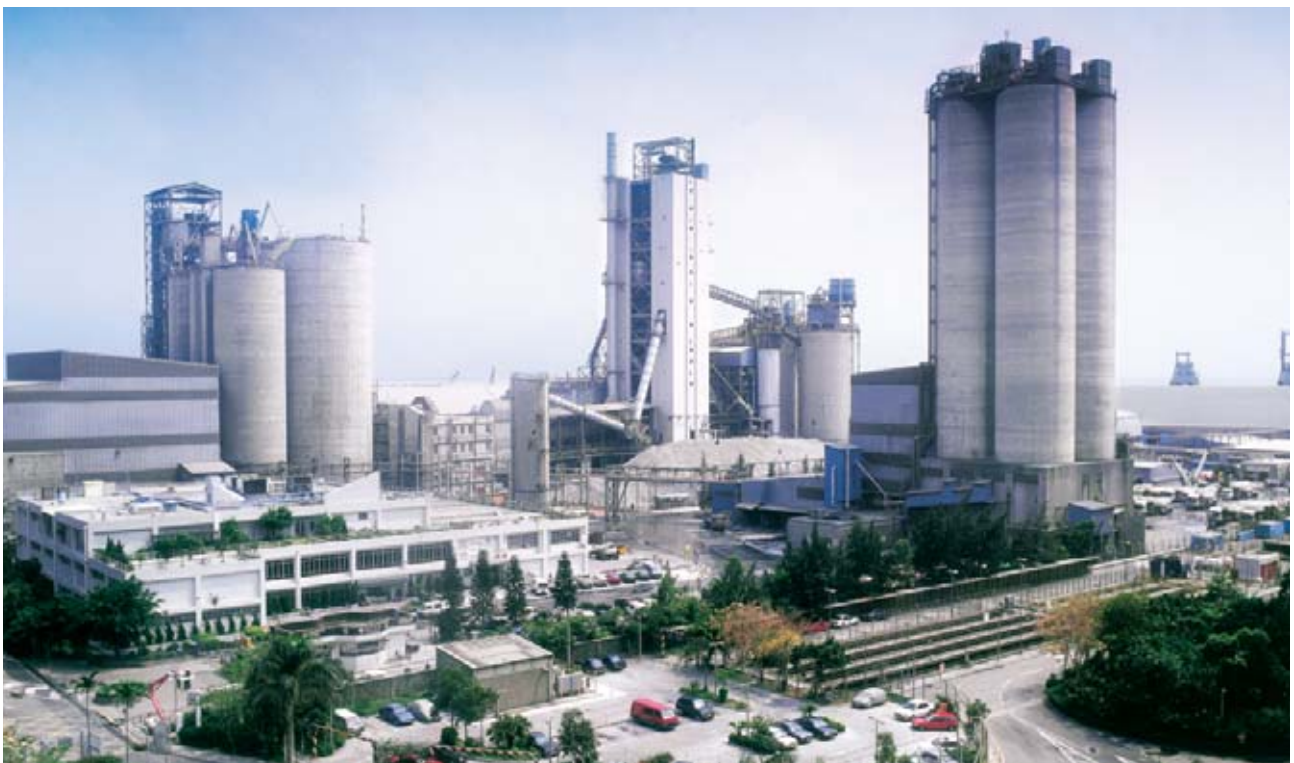
青洲英坭於年內運作順暢。