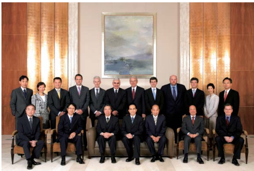
於二零零六年，Northern Gas Networks 首度為長江基建提供全年溢利貢獻。

長江基建持有 Northern Gas Networks 百分之四十權益。年內，該項目首度為集團提供全年溢利貢獻。儘管二零零六年秋冬氣候和暖，Northern Gas Networks 的表現非常理想，為長江基建帶來雙位現金回報率。