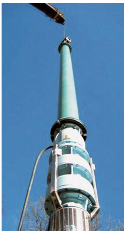
Cambridge Water 為英國南劍橋郡的用戶供應自來水。

AquaTower 於二零零六年的總供水量達二十七億九千五百萬公升，可供應約二萬五千人日常生活所需。該項目持續為集團提供穩定的貢獻。