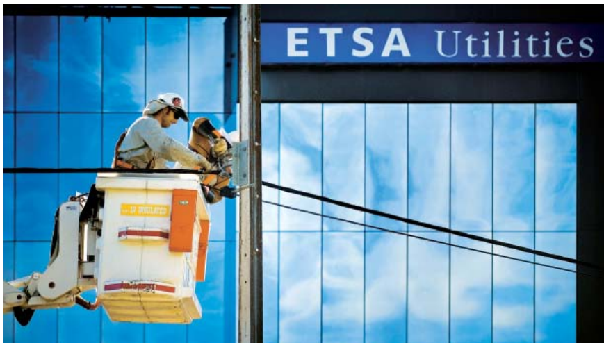
ETSA Utilities 是南澳洲省的主要配電商。

長江基建持有 Envestra 百分之十六點四權益。自一九九九年，該項目一直錄得雙位現金回報率。