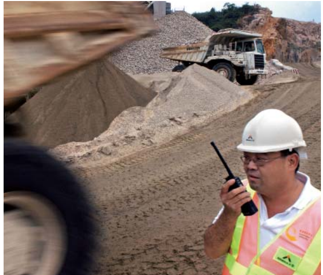
友盟於藍地石礦場的採礦合約延續至二零一五年，有助鞏固該公司於本地石料市場之領導地位。

青洲國際繼續就「環保熔化」技術商業化進行可行性研究。「環保熔化」是一項以高溫處理廢物之創新技術，由該公司與香港科技大學共同研發。