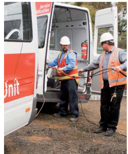
CitiPower 的配電網絡覆蓋一百五十七平方公里，於墨爾本市商業中心區及市郊一帶提供服務。