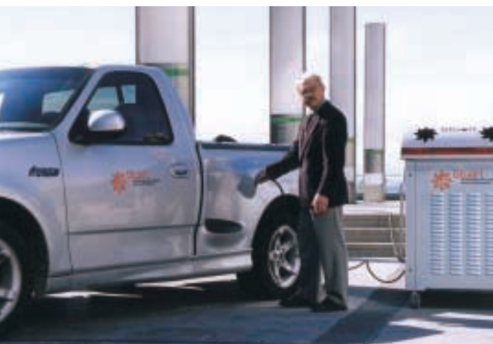
Stuart Energy Systems Corp. 與 Hydrogenics Corporation 合併成為全球主要潔淨能源方案開發商之一。

Stuart Energy Systems Corp. 繼於二零零二年與Vandenborre Technologies, N.V. 合併後，再與Hydrogenics Corporation (著名的燃料電池產品和氫燃料供應系統之設計、開發及生產商) 完成合併，令長江基建持有該公司之權益被進一步攤薄至約百分之二。