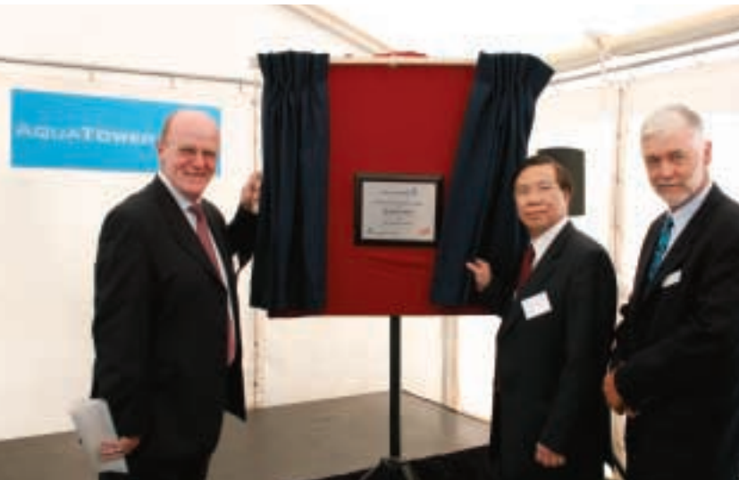
集團購入AquaTower百分之四十九權益。該水廠獨家供應澳洲維多利亞省內四個城鎮之飲用水。