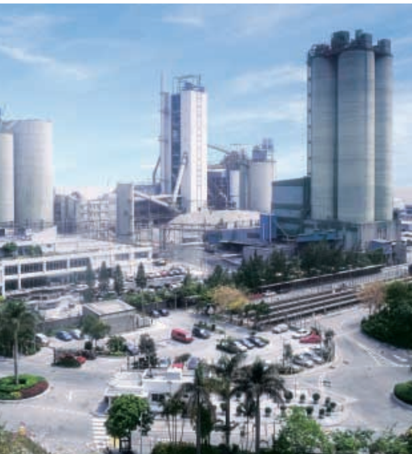
青洲英坭在本地水泥業具領導地位。