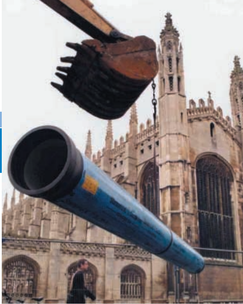
長江基建首度涉足英國水處理業務，收購成立於一八五三年的Cambridge Water全部權益。

是項收購涉資超過港幣七億元（英鎊五千一百三十七萬五千元），預期Cambridge Water將為長江基建提供穩健而可觀的雙位數字回報，並於未來持續增長。