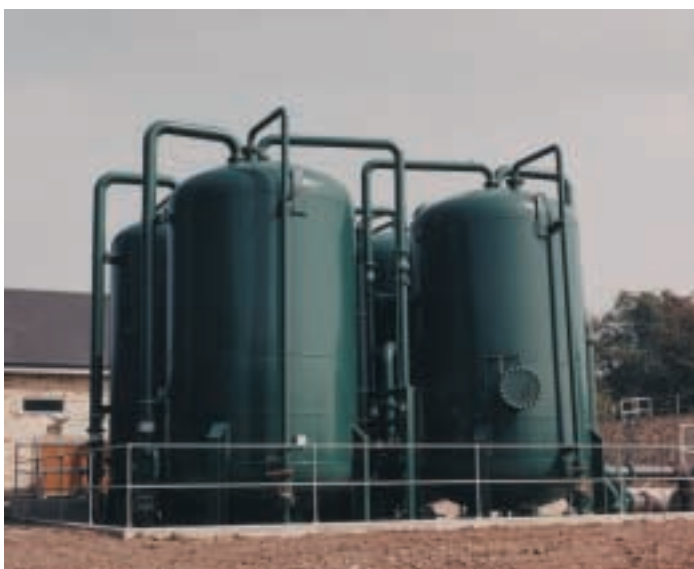
Cambridge Water營運表現極具效率，獲Office of Water Services推許為營運效率最高的機構之一。