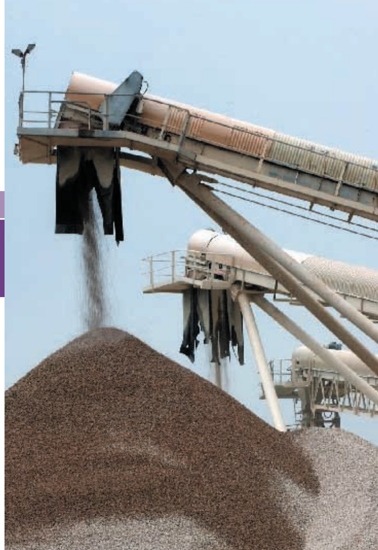
安達臣大亞之混凝土及石料業務與Hanson PLC香港支部的合併是一項適時之策略性行動。

年內，瀝青市場仍受疲弱之建造業市道影響，安達臣瀝青繼續推行嚴控成本措施，並在預算範圍內錄得輕微之經營溢利。