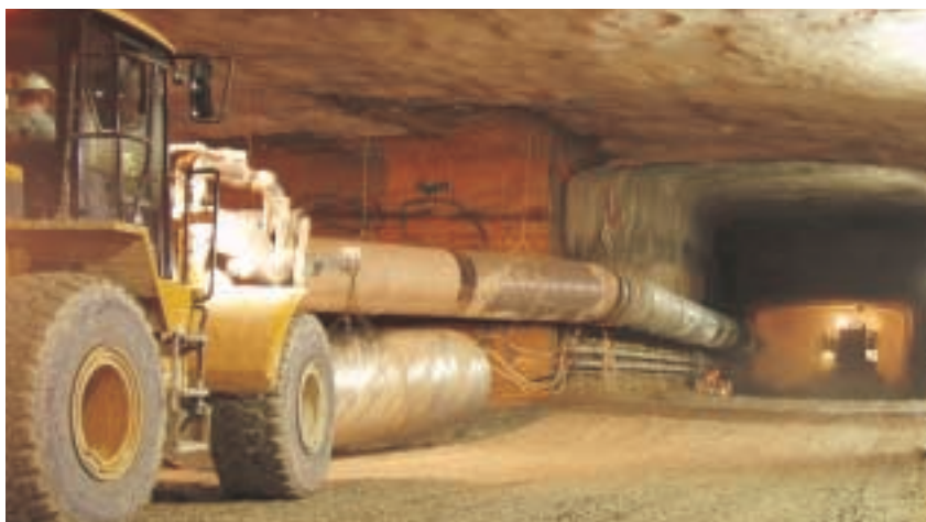
Lane Cove Tunnel 的挖掘工程於二零零四年四月展開，進度良好。

Lane Cove Tunnel 建於Epping Road地底，將Gore Hill Freeway及North Ryde的M2 Motorway之間的重要通道連接起來，是悉尼市最重要之環路建設的最後一環。Lane Cove Tunnel之挖掘工程於二零零四年四月展開，迄今進度良好，預期該隧道可於二零零七年年中落成；通車後，估計平均每日車流量將高逾十萬架次。該項目總投資額為澳幣十七億元，經營期為三十年（不包括建築期），預計可為集團提供穩健的雙位數字的回報率。