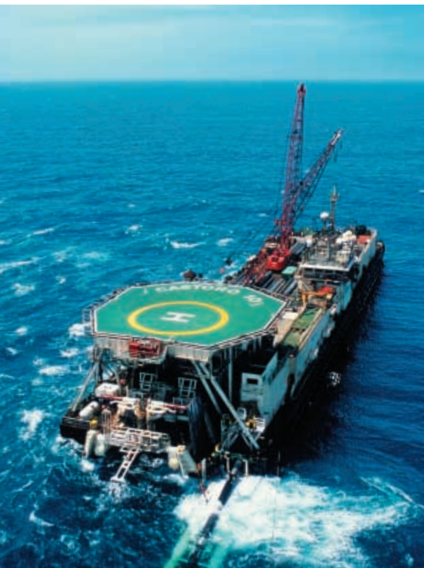
這艘鋪管船正在為香港電燈鋪設連接深圳與南丫島的天然氣管道，以便日後為渦輪燃氣機組供氣。

南丫島發電廠第九台新機組預期於二零零六年投產，有關項目的進展持續理想。首台三百兆瓦發電機組